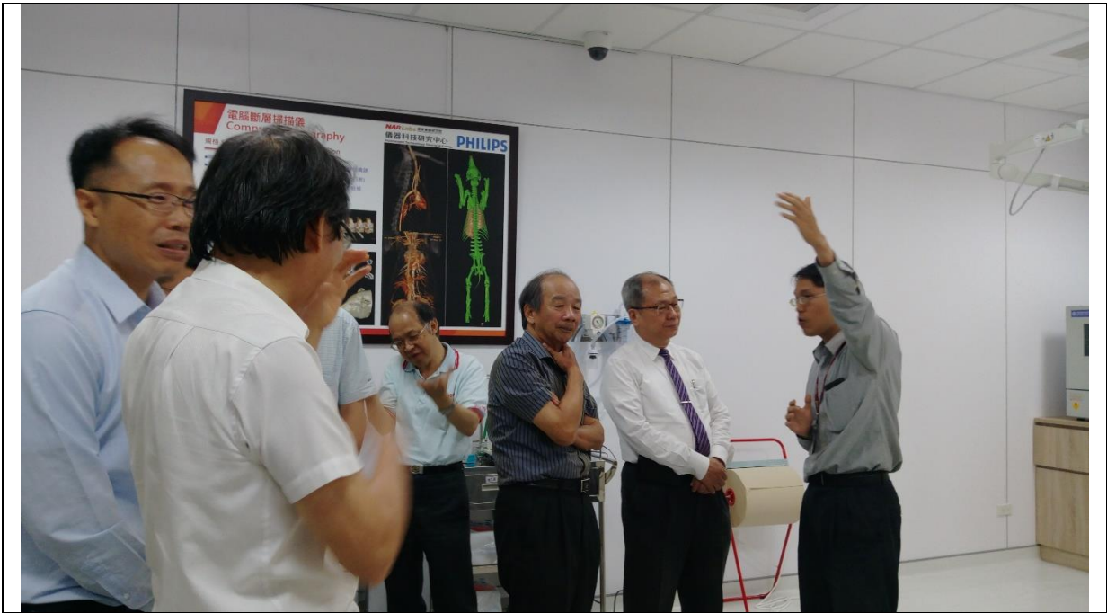
理監事聽取實驗室人員說明