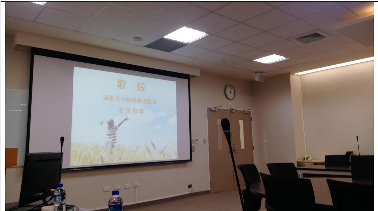
歡迎自動化科技學會理監事參訪